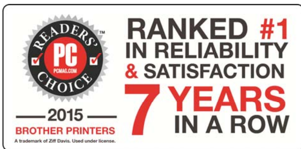
▲ 브라더 PC 매거진 '2015 리더스 초이스 어워드' 7년 연속 수상

또한 브라더는 비즈니스용 제품에 대한 소비자 만족도 및 신뢰도, 견고성 등을 평가 기준으로 선정하는 PC 매거진의 '2015 비즈니스 초이스 어워드'에서도 3년 연속 1위에 오르며 “가정용과 사무용 제품 모두 브라더의 독주는 계속될 것으로 보인다”는 총평을 받았다.