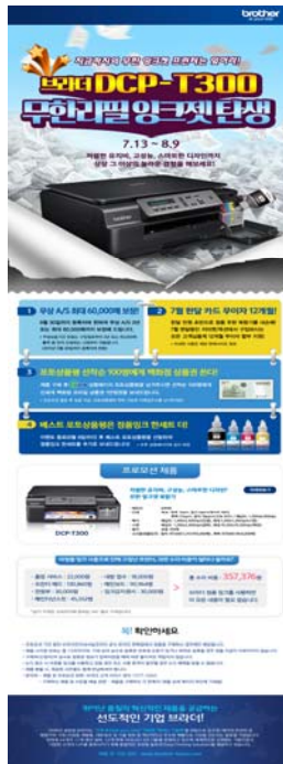
< 브라더, 프로모션 메인 이미지(지마켓) >